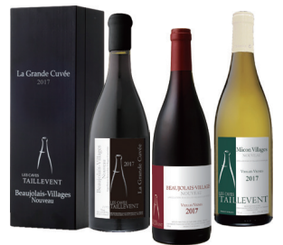
ワイン 50ml×5 種 モン・ドール

◎お申し込み&問い合わせ◎ エノテカ&ケーシーズ 札幌円山店 TEL.011-633-8086