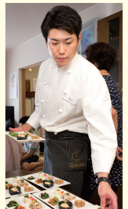
北海道庁知事公認 「北海道らしい食づくり名人」、 北海道フードマイスター